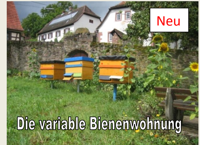
Die variable Bienenwohnung

Die neue freistehende Variobeute bereitet nicht nur Bienen, sondern auch Imkern Freude