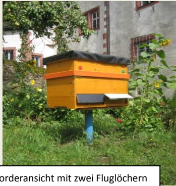
Vorderansicht mit zwei Fluglöchern

Bienenwohnung lässt sich senkrecht teilen für Zwei-volkbetriebsweise mit zwei Fluglöchern; auch gut geeignet zur Ablegerbildung