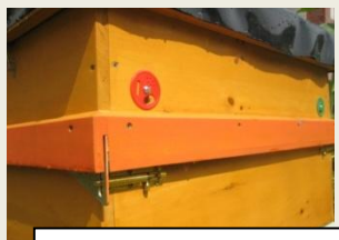
Umlaufender Falz und Riegelscharnier mit Langloch

Höhenverstellbarer Standfuß ermöglicht imkern in aufrechter Körperhaltung