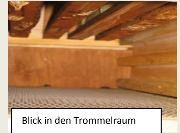
Blick in den Trommelraum

Umlaufende Falz schützt vor Sturm und Schlagregen