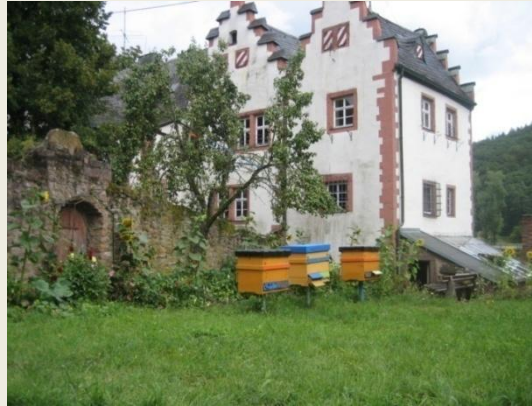
Ein Blickfang in jedem Garten

Die Bienen freuen sich über die gute Hygiene und kurzen Wege. Weniger Stress für die Bienen beim Öffnen und bei der Wabendurchsicht. Keine Belästigung durch Mäusen, Ameisen, Schlagregen, Kälte und Hitze, aufsteigende Feuchtigkeit, schlechte Luft u.v.m.