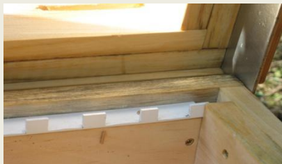
Exakte Wabenabstände ohne Verbauung

Die Bienen freuen sich über die gute Hygiene und kurzen Wege. Weniger Stress für die Bienen beim Öffnen und bei der Wabendurchsicht. Keine Belästigung durch Mäusen, Ameisen, Schlagregen, Kälte und Hitze, aufsteigende Feuchtigkeit, schlechte Luft u.v.m.